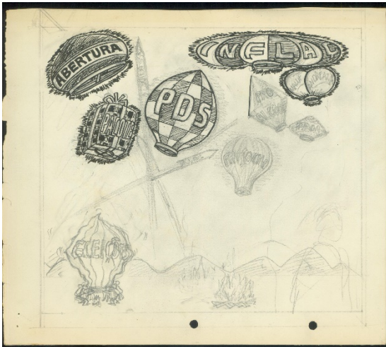
Figura 3 – Desenho publicitário