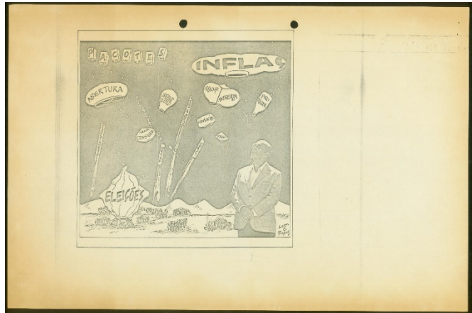
Figura 4 – Fotomontagem publicitária