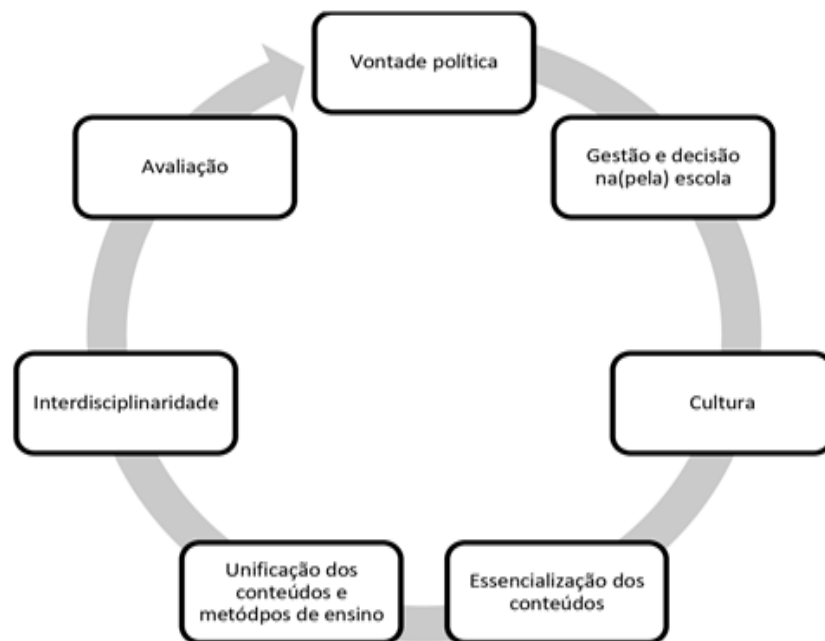
IMAGEM 3 - Os sete eixos formativos do CIEPs.