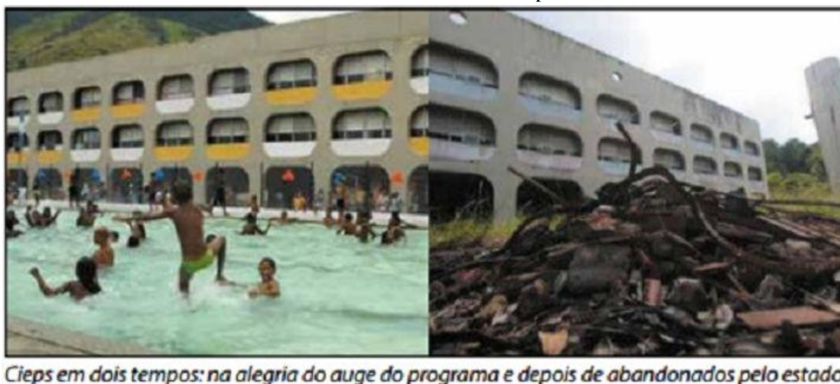
IMAGEM 4 - CIEPs antes e depois.

Cieps em dois tempos: na alegria do auge do programa e depois de abandonados pelo estado