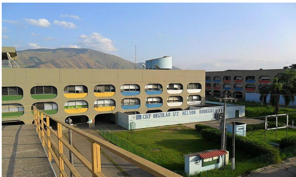
IMAGEM 2- CIEP Nelson Rodrigues.